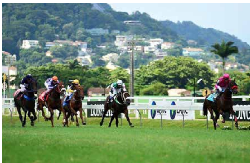
Silja ligger som nummer to med Champion Forever i Brasil.

betrodd. I Qatar red jeg Belhambar, en hest som hadde kommet fra Irland og tydeligvis ikke trivdes på den harde banen i Qatar, for han hadde ikke tjent en krone siden han kom halvannet år før. Han var gigantisk, som en kamel, og raget over de andre hestene. Vi endte som nummer ni i et felt på elleve.