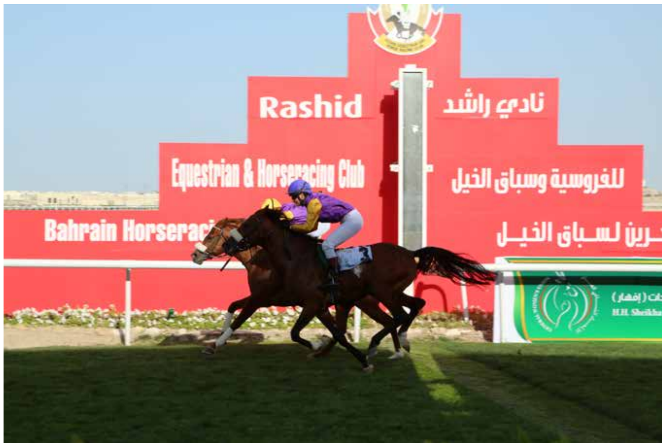
Tett oppløpsfinish i Bahrain.