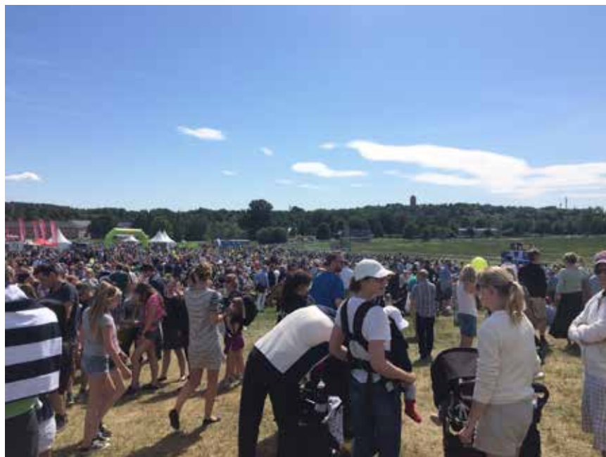
Stor stemning under løpene i Stockholm.

Løpsdagen kom, og alle jentene ble puttet inn på et bittelite rom hvor vi skulle skifte. Det var det vanlige kaoset,