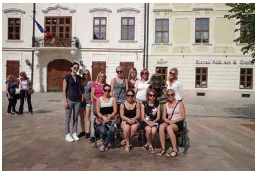
På sightseeing i Bratislava.

Deretter bar turen til banen, hvor vi satte fra oss utstyret i garderoben og