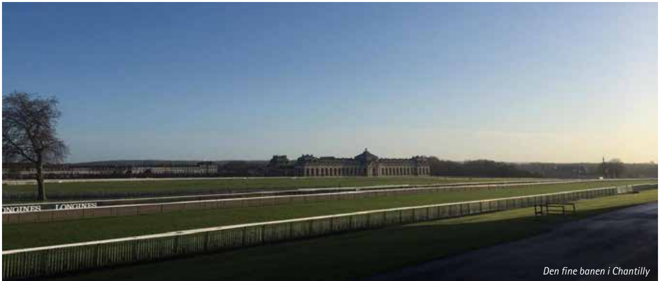
Den fine banen i Chantilly