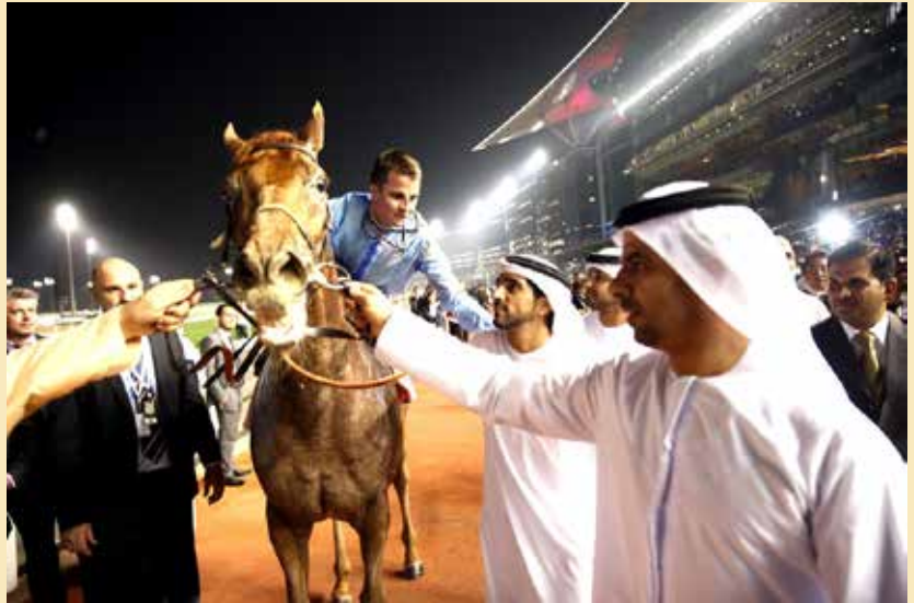
Hyllest etter seieren i Dubai World Cup med hesten Prince Bishop.

– Selv om interessen for hestene er forskjellig for hver og en av dem, er de flinke alle sammen. De må få pleie sine interesser som de vil, avslutter han. Og jeg synes jeg kan skimte et aldri så lite snev av stolthet i pappa Buicks øyne.