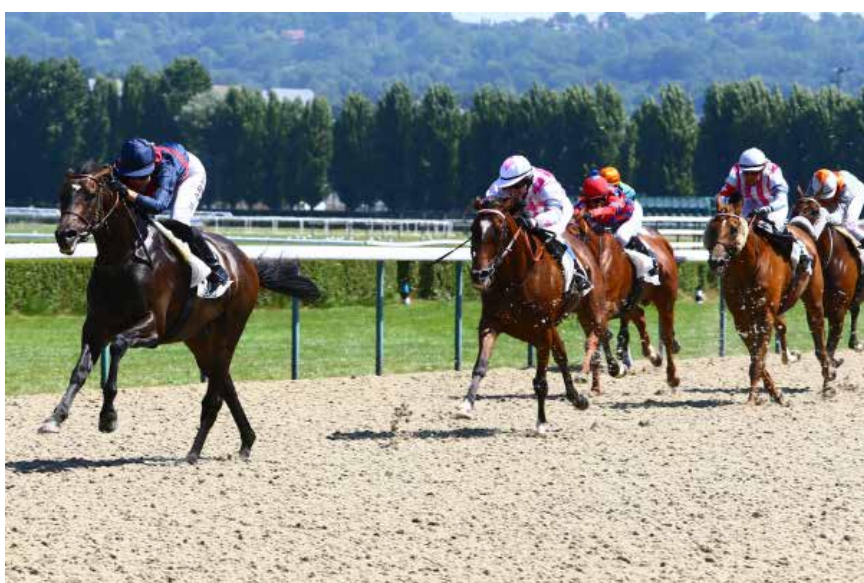
Nummer to med Zawa Song i Deauville i rosa.