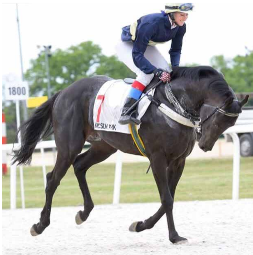
Silja og Bandavezer cantrer til start i proffløp i Ungarn.

i USA, med to seire, en annen og en femte på fire ritt. Da jeg så hestene mine kunne jeg ikke helt se at det skulle kunne gjentas. I det første løpet på Pimlico red jeg Hard Drive, som hadde blitt pullet opp i sitt forrige løp da han ikke kunne følge