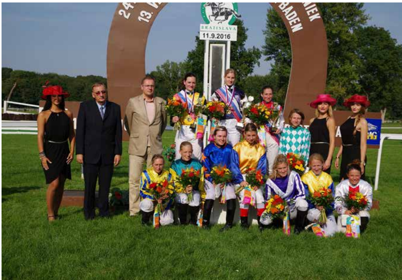
Premieutdelingen på banen i Bratislava, etter at de fire EM-løpene hadde blitt ridd.