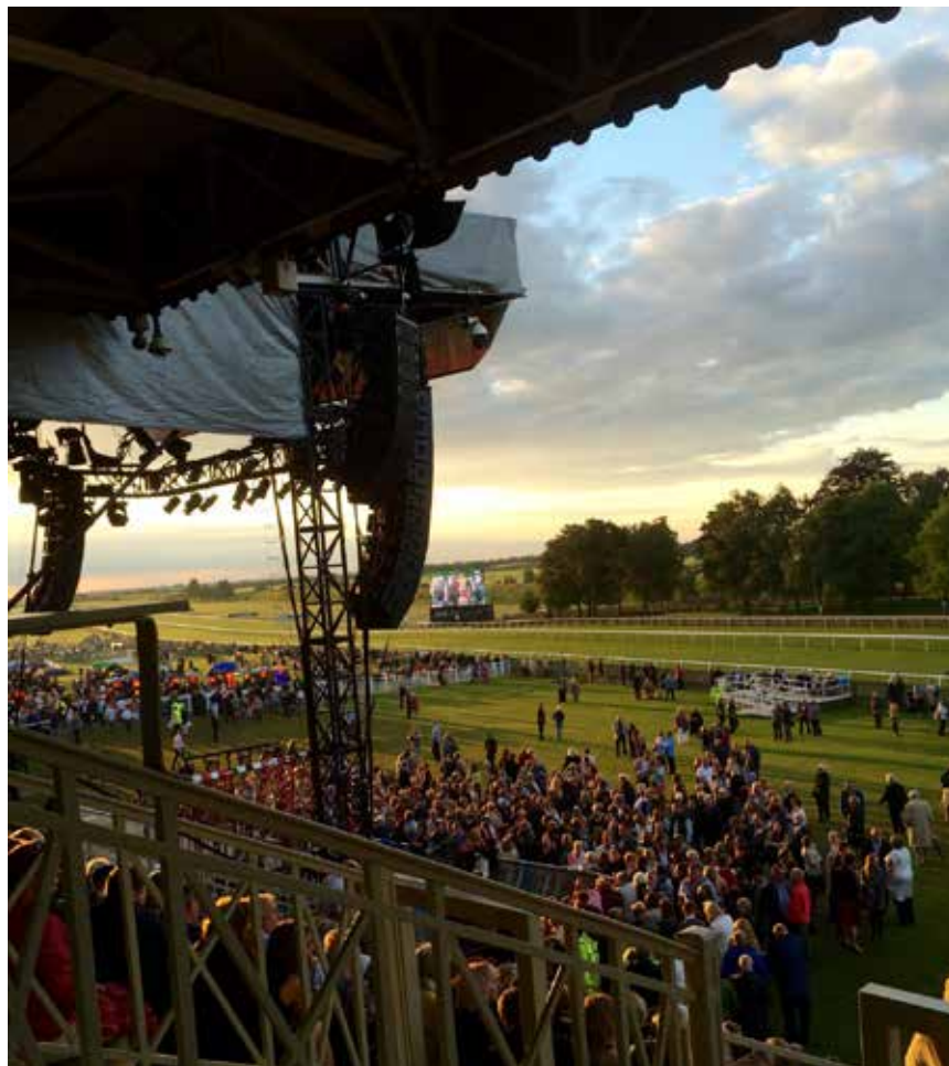
Før konsert med Will Young på galoppbanen.

«Hestene var til tider utfordrende og vi fikk oss overraskelser i form av buking, heftig pulling og «flip arounds».»