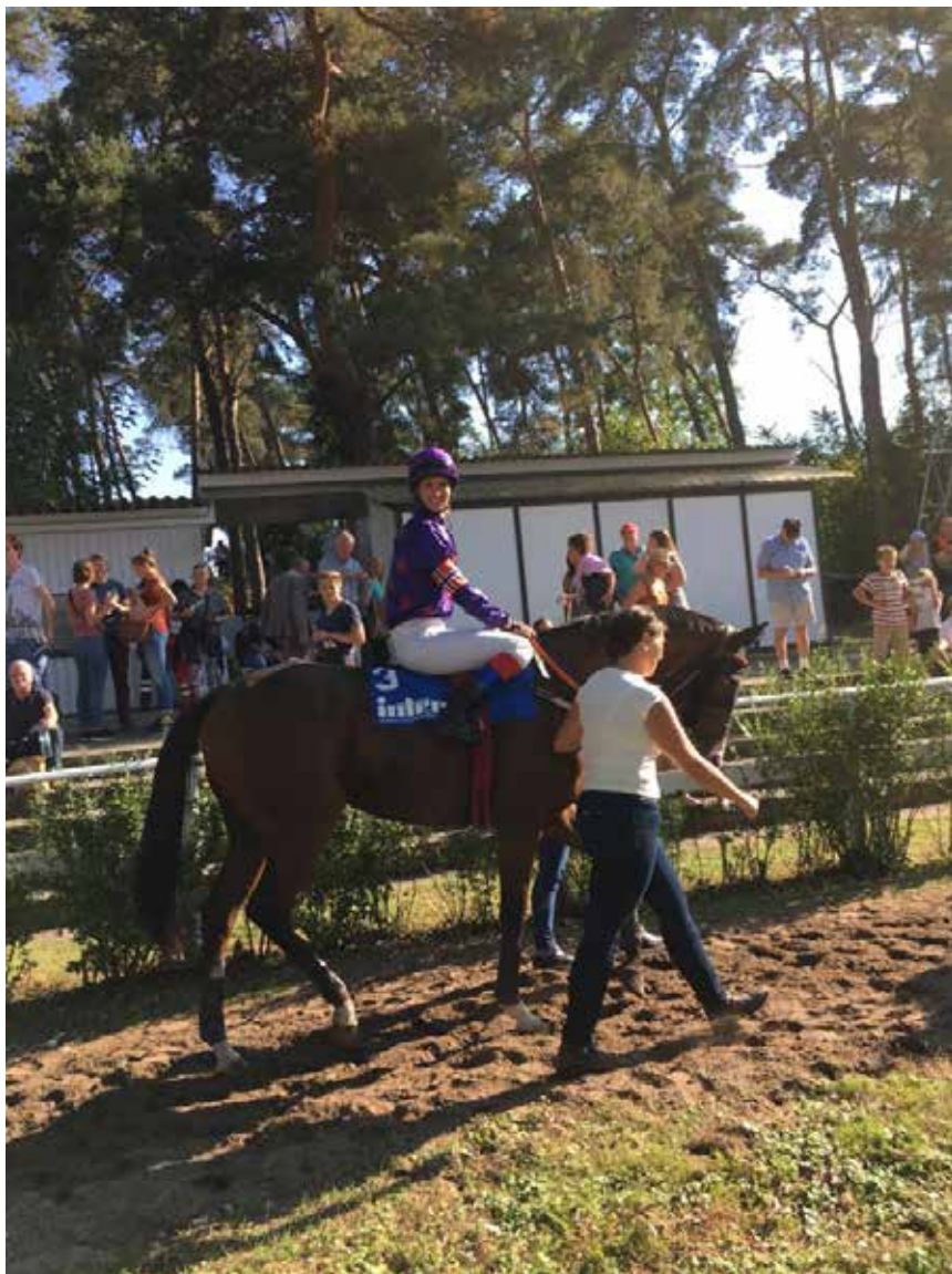
Silja på gigantiske Hachico i Mannheim.

treneren mente han trengte løpet. De sa han kunne pulle mye, så jeg skulle holde ham igjen bak hester. Vi sprang fint av og jeg la ham inn, men han pullet aldri spesielt og vi endte på en 7. plass.