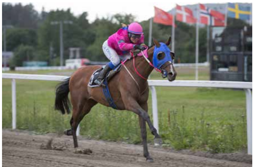
Josephine Chini og Sophies Love på vei mot en enkel seier.