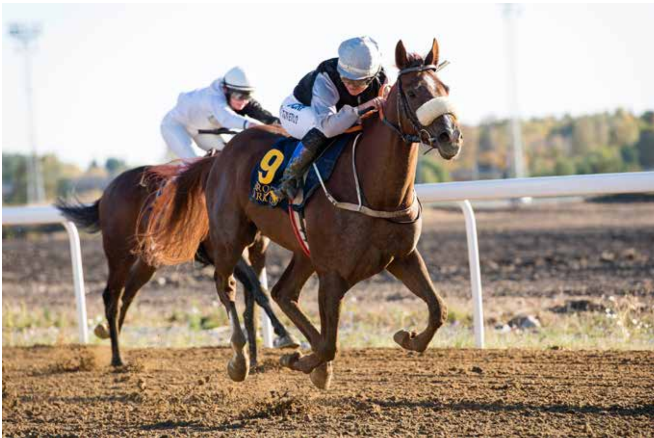
Første seier på Bro Park med Tomhid.