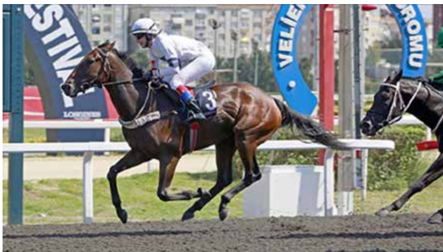
Vinner i Istanbul på Autumn Pearl.