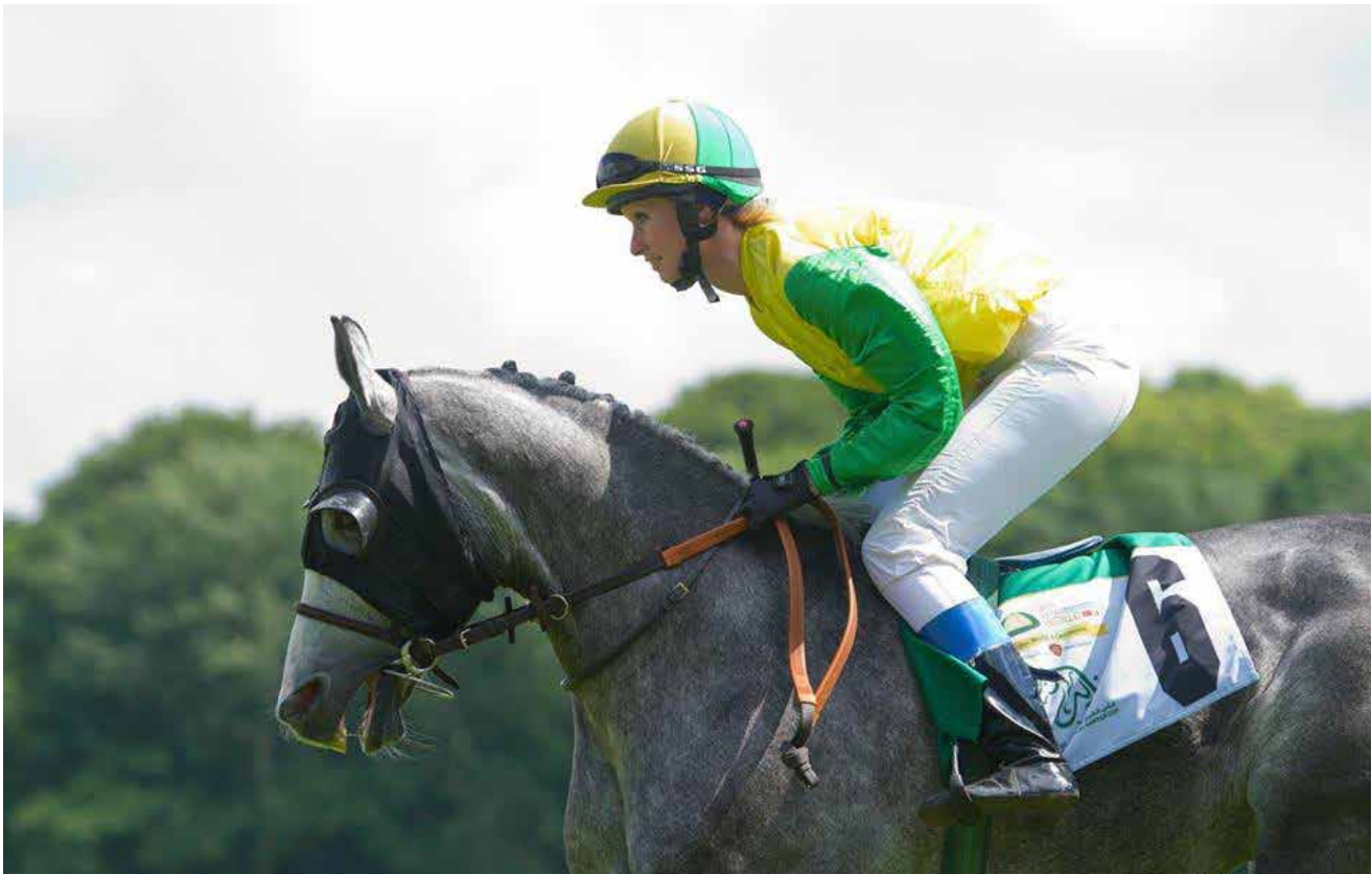
Silja cantrer til start på L'eau de Tigre.

Hesten sprang fint av, men fant seg ikke helt til rette på banen som har en spesiell profil. Vi endte i de bakre rekker. På Gärdet står publikum helt inntil gjerdet langs hele banen, noe som er med på å skape en unik stemning. Samtidig kan det være utfordrende for ukonsentrerte hester.