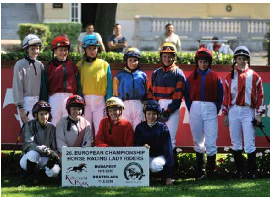
Deltakerne i årets europamesterskap før start i det første løpet i Budapest.