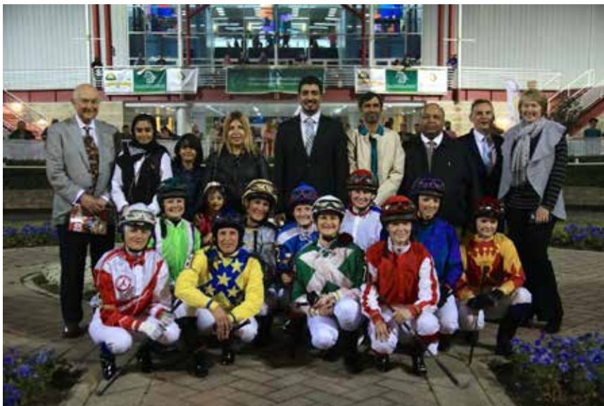
Rytterne før løpet i Texas.

godt feste, men var samtidig myk. På veien tilbake til hotellet ble det bestemt at vi skulle på rodeo, så det var rett opp å skifte også videre til rodeo. Rodeoen var inne i en stor stadium som het NRG stadium, den hadde kapasitet til å romme 80 000 mennesker! Vi hadde en fin stund på rodeoen etterfulgt av konsert med Jason Derulo.