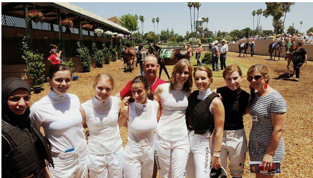
Noen av rytterne før løpet i Pleasanton.

Det var en opplevelse å ri løp på en araberhest for første gang og å besøke denne sjarmerende, Belgiske banen. Jeg gledet meg allerede til å få en ny sjanse på ryggen til en araberhest, samt å få ri på en ny galoppbane i et annet land.