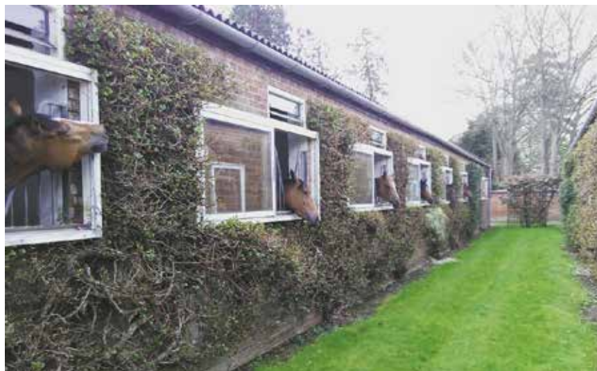
En av stallene hos Cumani i Newmarket der Frida var på opphold våren 2016.

Etter tre uker praksis på Jægersro, reiste jeg tilbake til Norge for å ri løp igjen før jeg skulle tilbake på skolen i