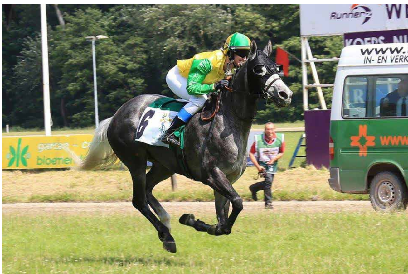
Silja vinner, merk leieren som løper på andre siden med et stort smil!

Kl. 14 samlet vi oss i lobbyen for å dra til banen som het Sam Houston Park for å fikse lisens og liknende. Vi fikk en omvisning i garderoben, og gikk også banen. Det var en fin bane, som hadde