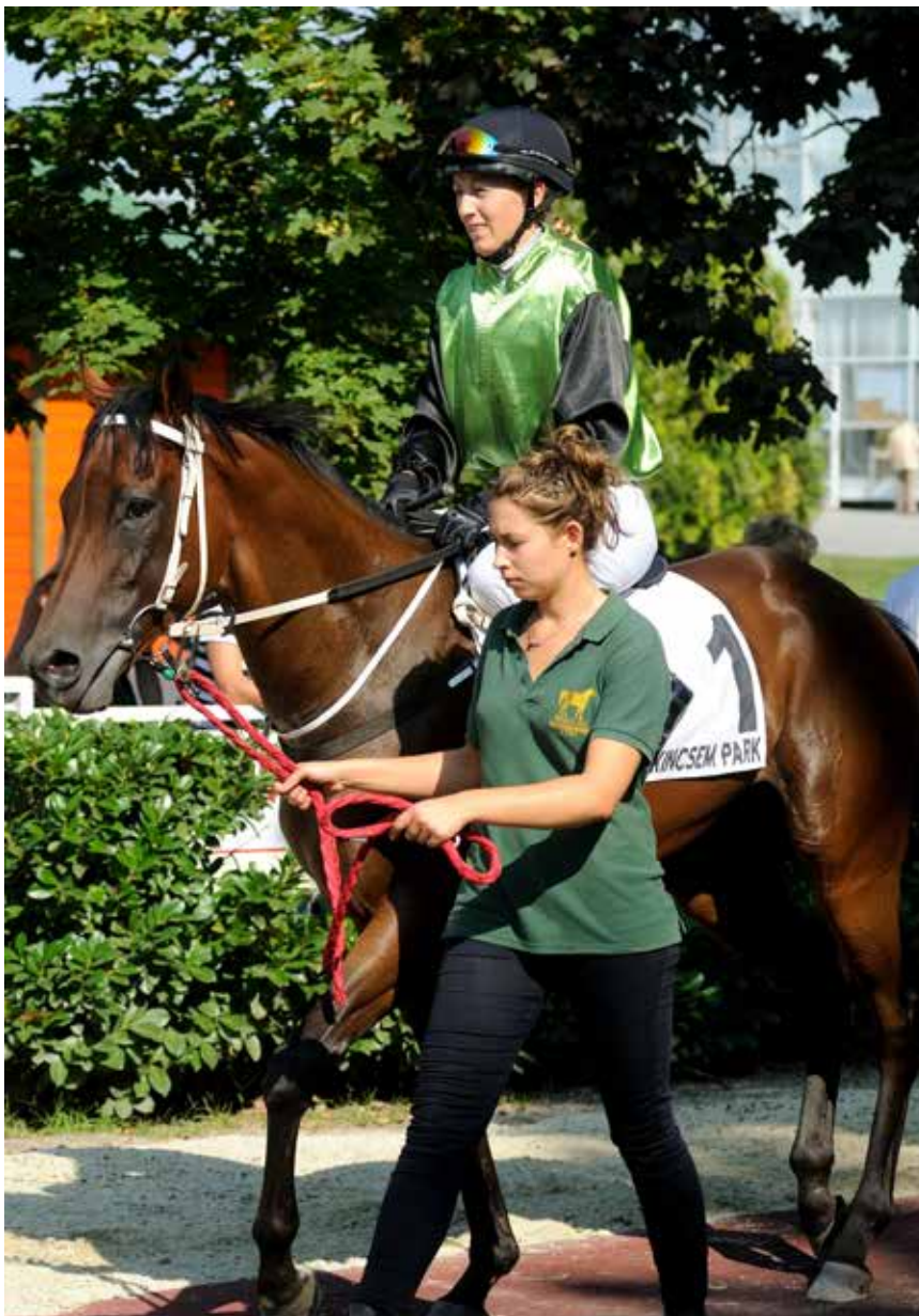
Jeg og Máramaros før det andre løpet på Kincsem Park.

Selv havnet jeg helt sist på resultatlisten, da jeg hadde fått færrest poeng av alle under mesterskapet. Det var selvfølgelig kjedelig å reise hjem til Norge uten bedre resultater i EM, men samtidig følte jeg at jeg hadde gjort det beste jeg kunne for å ivareta sjansene mine i løpene. Likevel vil jeg ikke være denne opplevelsen forunt, for det å delta i EM er en opplevelse for livet, enten man havner først eller sist på resultatlisten. Selv om vi var elleve jenter som konkurrerte mot hverandre i banen, ble nye bånd knyttet og vi ble gode venner i løpet av helgen. Det at alle gleder seg over andres fremganger og prestasjoner, og at man deler opplevelser og erfaringer med hverandre, er noe som virkelig preger dette europamesterskapet. Jeg er veldig takknemlig for at jeg fikk muligheten til å representere Norge i EM!