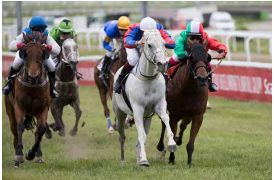
Her ble det kamp om seieren, som skimle Aaron's Way vant.