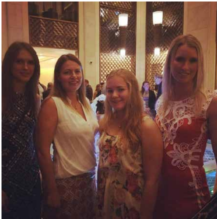
De norske jentene i Abu Dhabi.