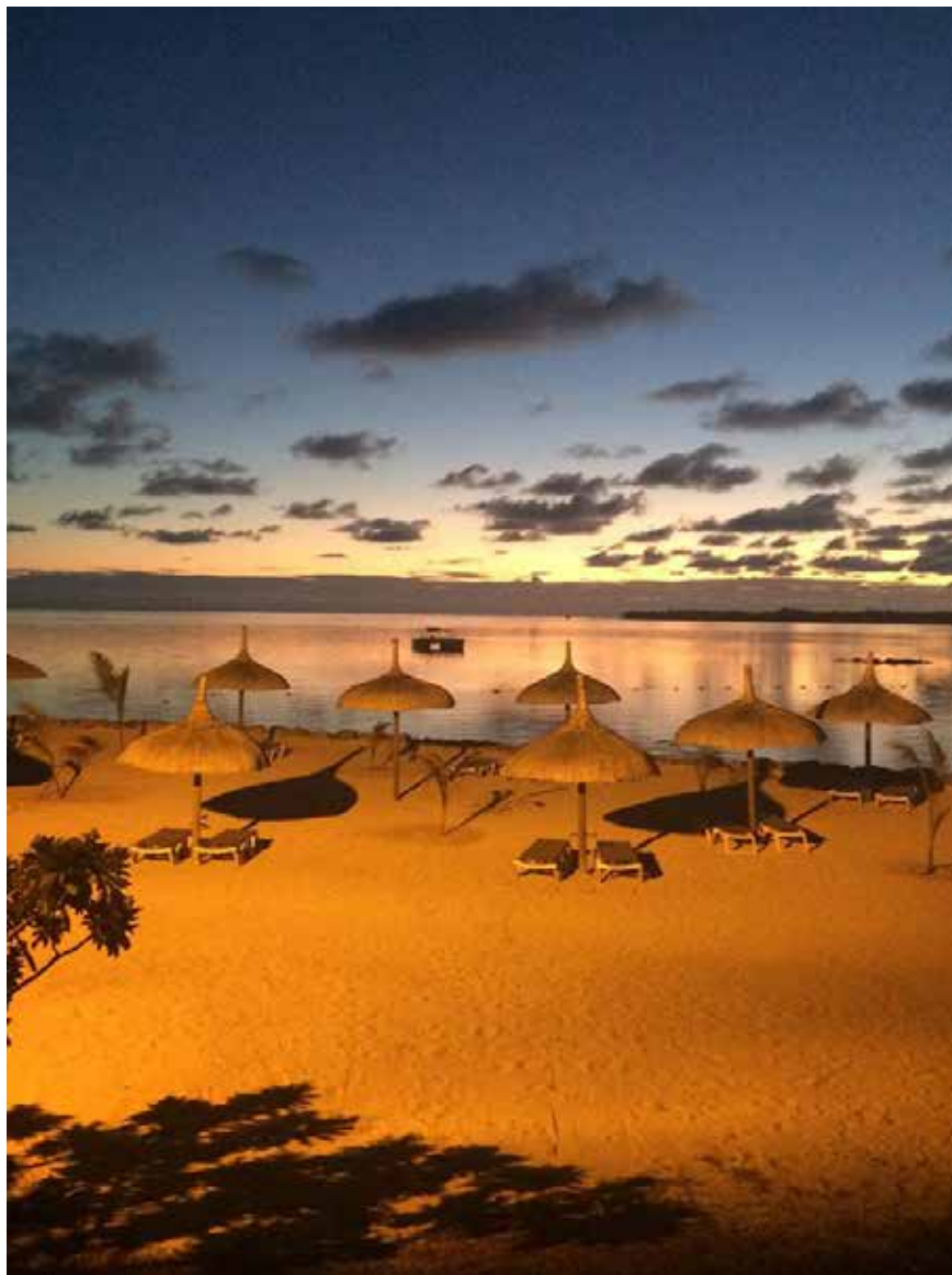
Soloppgang på Mauritius før rytterne skulle til banen og ri i trening.

Jeg er veldig takknemlig for muligheten NoARK gir oss til å reise. Vi får fantastiske muligheter til å reise og oppleve nye land, og vi får ri på baner en vanlig gjennomsnittsjockey sjelden vi får mulighet til å ri på. Det er utrolig lærerikt og jeg disse tre årene har gitt meg mye kunnskap og minner å ta med meg videre. Jeg har møtt fantastiske mennesker, ridd mye fine hester og fått oppleve racing i mange forskjellige kulturer.