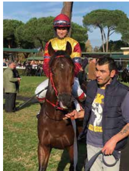
I paddocken før løpet i Pisa.

Vi skulle ri 1900 meter med tre svinger og jeg red den minst betrodde hesten, en gigant som het Hachico. Han var virkelig alt for stor for denne banen! Han var 185 cm høy og da vi sto inne i startboksen