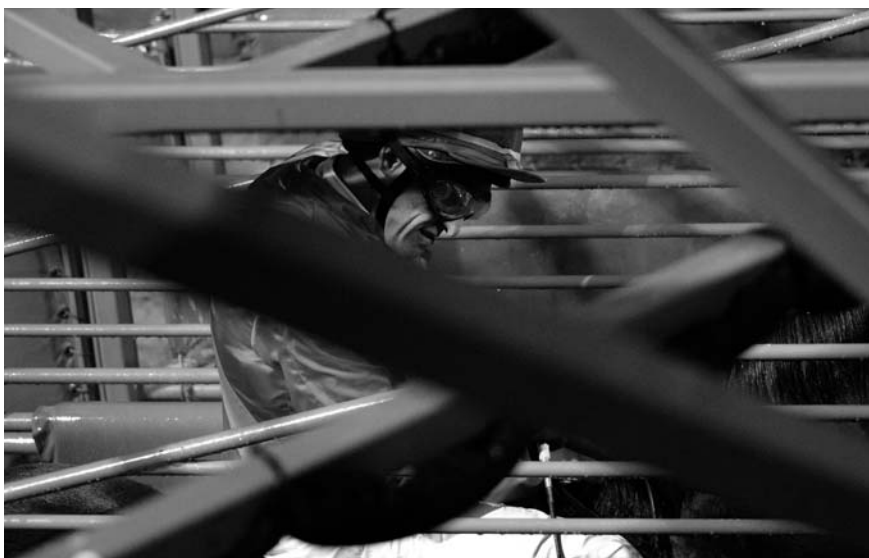
NoArk formannen fra en litt annen vinkel.

«Jeg forsøker å komme så nær banen som mulig, så nær hesten og feltet som det går an, og det er i grunnen synd at ikke publikum kommer nærmere enn de gjør. Det er jo flest løp på dirten, mens det er gressbanen som lig