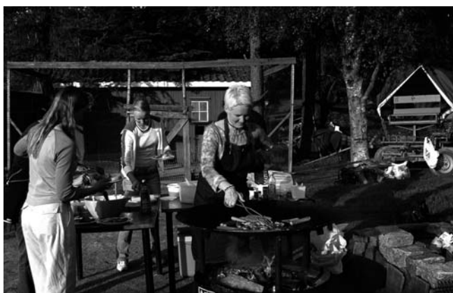
På utflykt «i skogen».

Etter løpene var det tradisjonen tro champagne på Jockeyklubben og middag på Stallkroa med påfølgende fest til latinamerikanske rytmer. Alt i alt ble det en vellykket helg og det var en veldig fornøyd gjeng som satte seg på flytoget til Gardermoen på mandags formiddag.