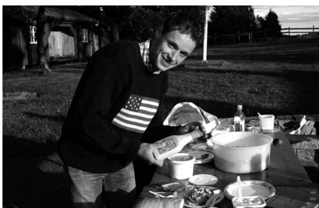
Tydeligvis måtte ikke alle bante - salatdressing må til for et skikkelig måltid.