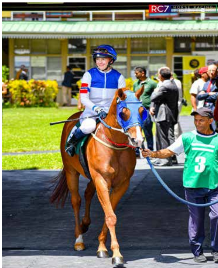
Emilie og Italian Way på vei til start.

Jeg vil takke NoARK for dette fantastiske året som representant i Fegentri. Jeg har virkelig hatt fantastiske opplevelser som jeg kommer til å huske resten av livet. Ikke nok med fine opplevelser, men jeg har fått flotte bekjentskap gjennom serien og har fått ridd fantastiske hester på ulike baner.