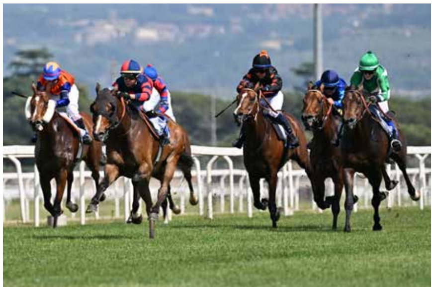
Emilie og Redmaggio utvendig i grønn drakt.

Jeg satt på hesten Redmaggio i et løp over 1700 meter på gresset. Vi hadde ytterspor men kom oss godt med i løpet.