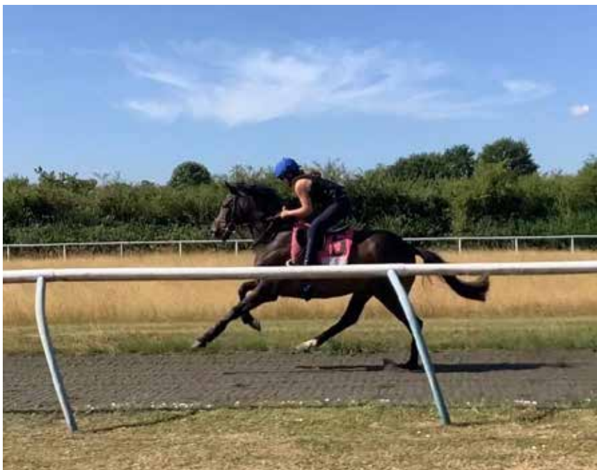
Mie i en god canter under øvelsen pace awareness.

En moderne spinningssykkel som kan beregne din fysiske form ut ifra vekt og prestasjonsevne under øvelsen.