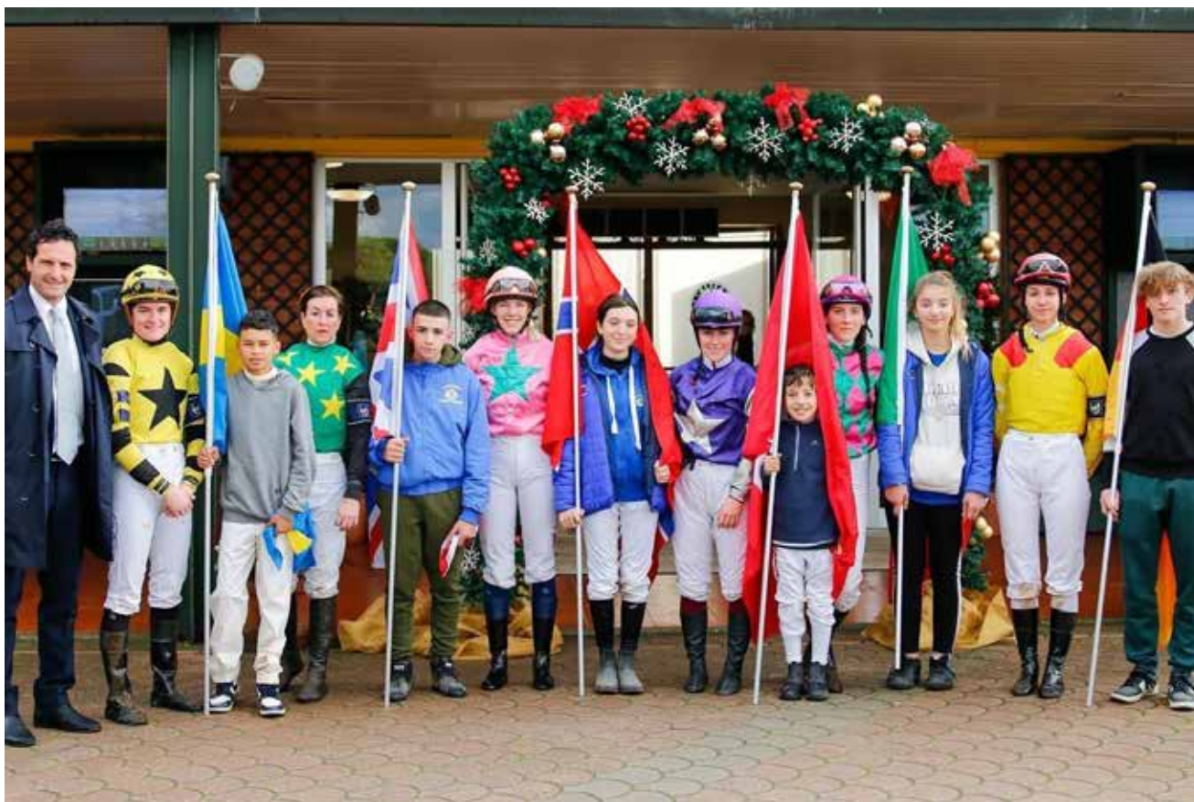
Klare for start – ponnirytterene følger hvert sitt land med flagg ut i visningspaddock.

Vi dro ut i Firenze etter løpene og spiste god pasta.