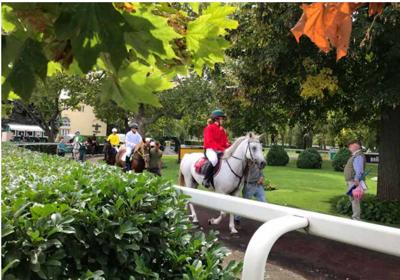
Ponniene går i visningsringen før løp på Kincsem Park.