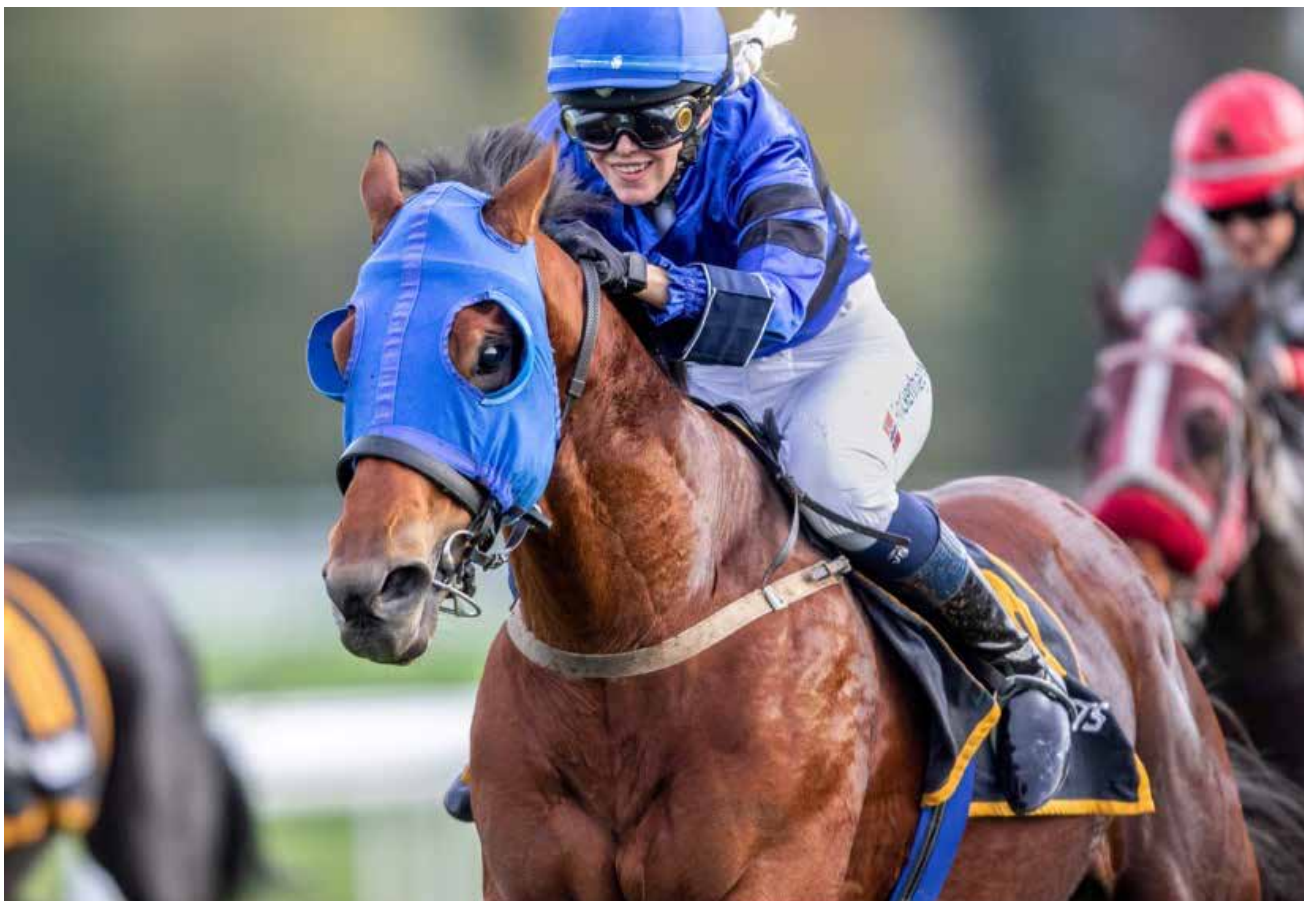
Emilie på oppløpet med SoSoft.

på frontkampen og holdt hesten tilbake. Igjen fikk jeg en fin reise på indre rail bak de andre to. Wind of Love gikk fint på bittet og da vi kom ut på oppløpet dro jeg henne ut fra feltet da jeg har sett fra replays at hun ikke fighter så godt med andre hester. Det ble et perfekt løp for Wind of Love og vi cruiset inn først i mål. Da jeg kom inn etter løpet gråt trener og eier. Fikk en god klem før jeg hoppet av. Helt uvirkelig å klare å ta en