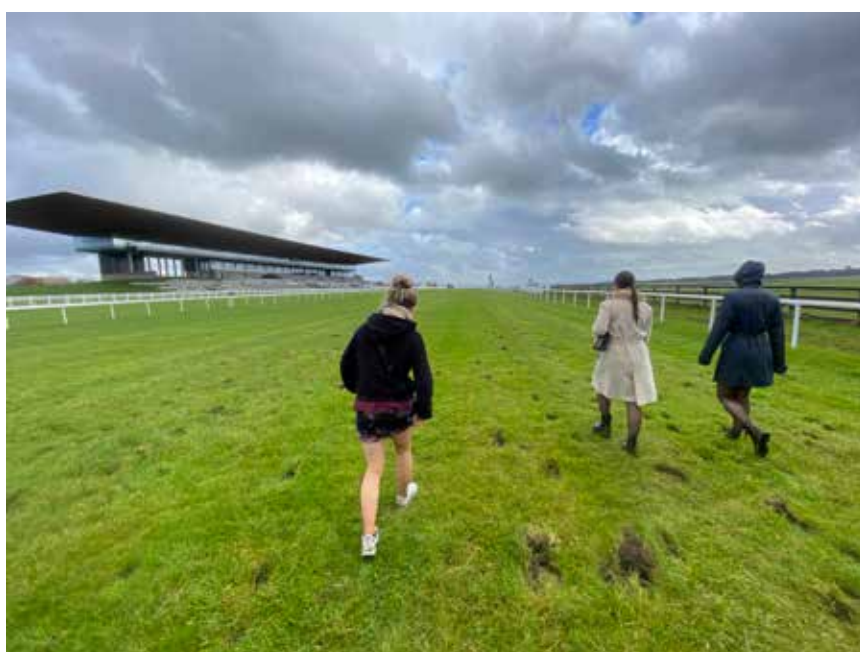
Noen av amatørerne går banen før løpet på The Currah.