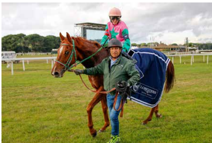
Fornøyd Emilie og treningsrytter av hesten etter seier med Xeres.