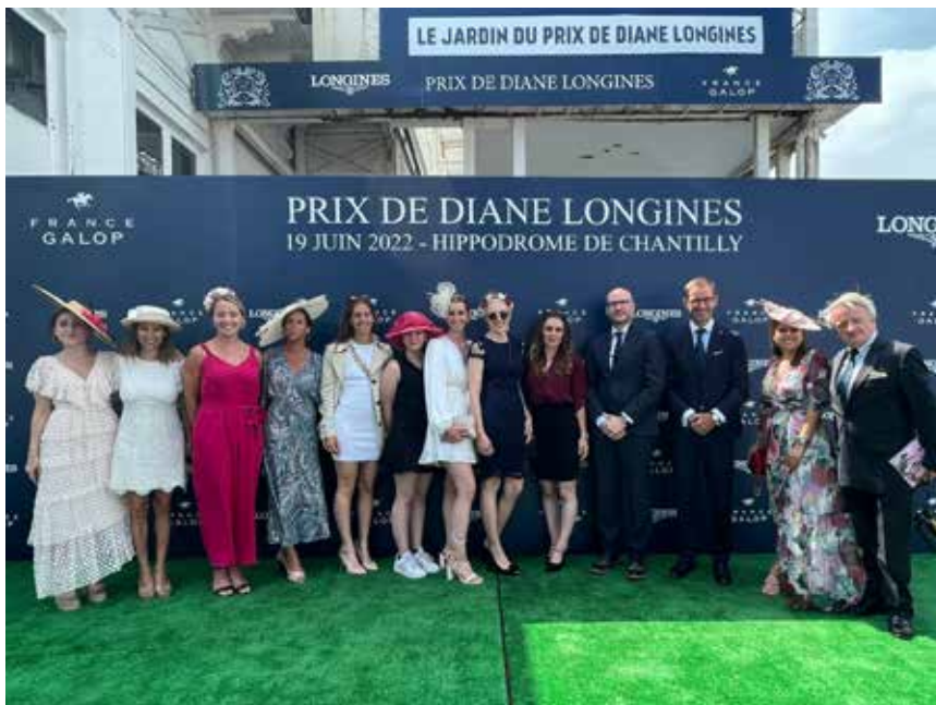
Teamet samlet, franske amatørrytterforbundet, Longines ambassadører, sekretær og president for Fegentri.