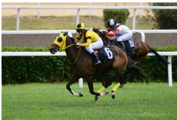
Lett seier på Wind of Love.