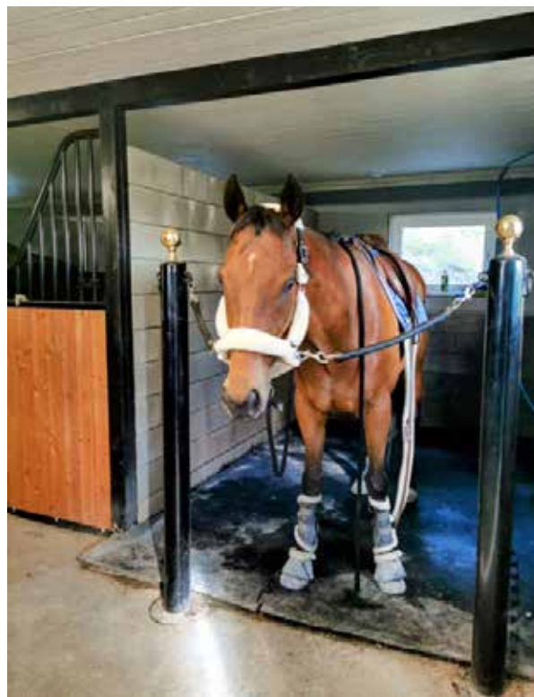
Klar for vask i sin fine nye stall.