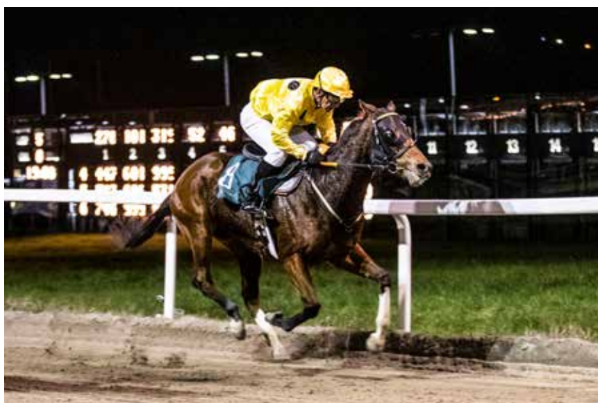
Vinnerekvipasjen, Finn og Airtrix.

Equine senteret i Newmarket. Denne kunnskapen tok han med seg tilbake til Norge etter ett drøyt års tid i Frankrike.