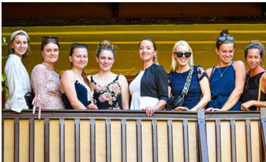
«Team Fegentri» studerer hestene på vei til start.

Endelig var det klart for finale på Mauritius. Siden det bare ble fem hester med i løpet mistet jeg muligheten til sammenlagtseier. Dermed hadde jeg